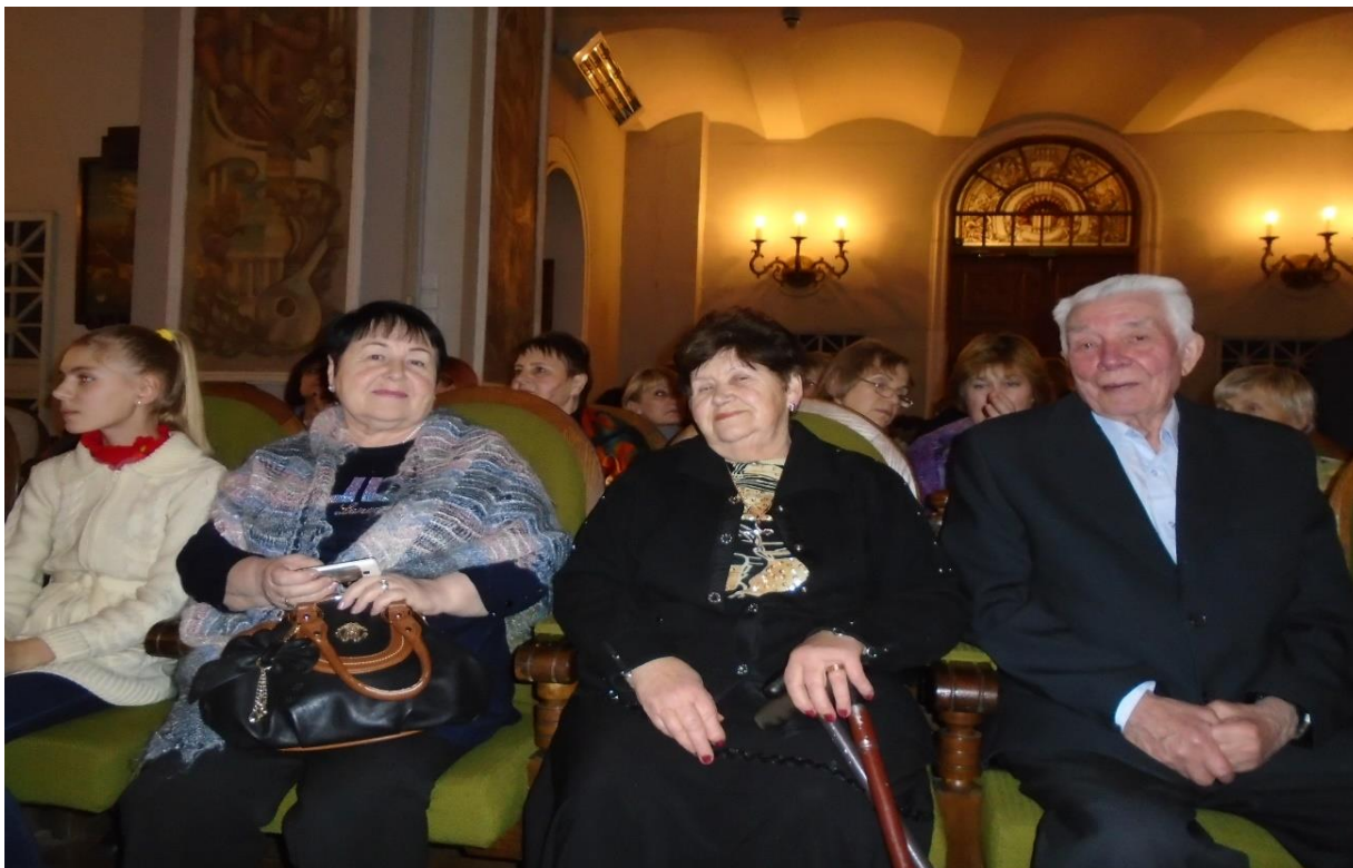
Після органної зали було відвідано Свято-Миколаївський храм.