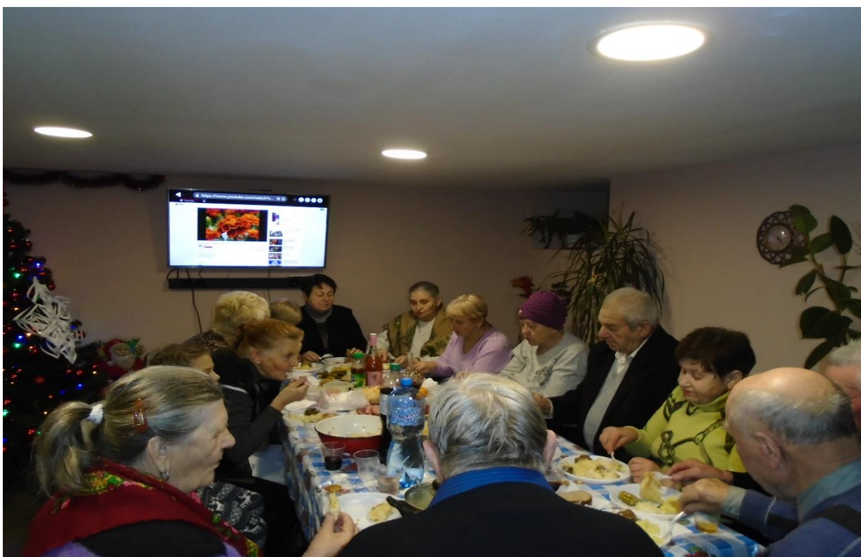
Силами відвідувачів денного відділення було організовано святкування Дня Святого Миколая та зустріч Нового 2018 року.

Наше денне відділення - це місце, де завжди чекають і радо зустрічають усіх, хто цього потребує.